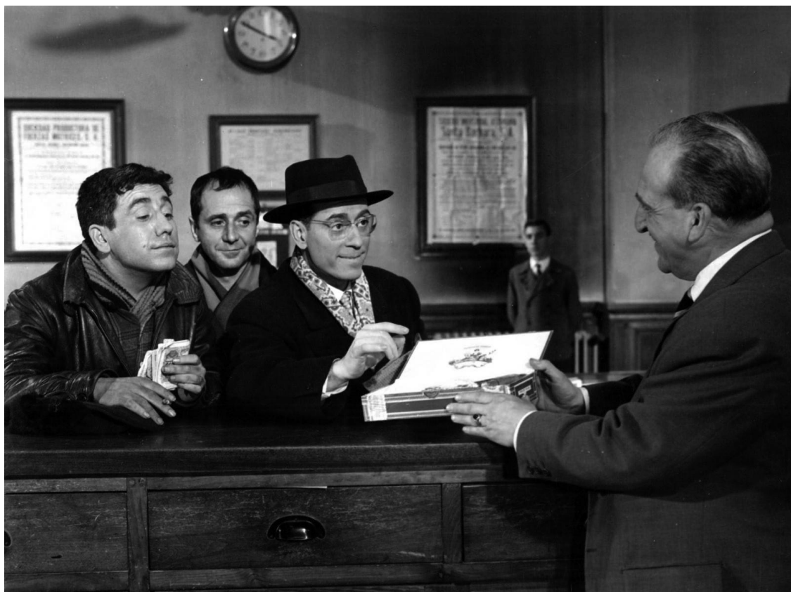
Plácido (1961), de Luis García Berlanga