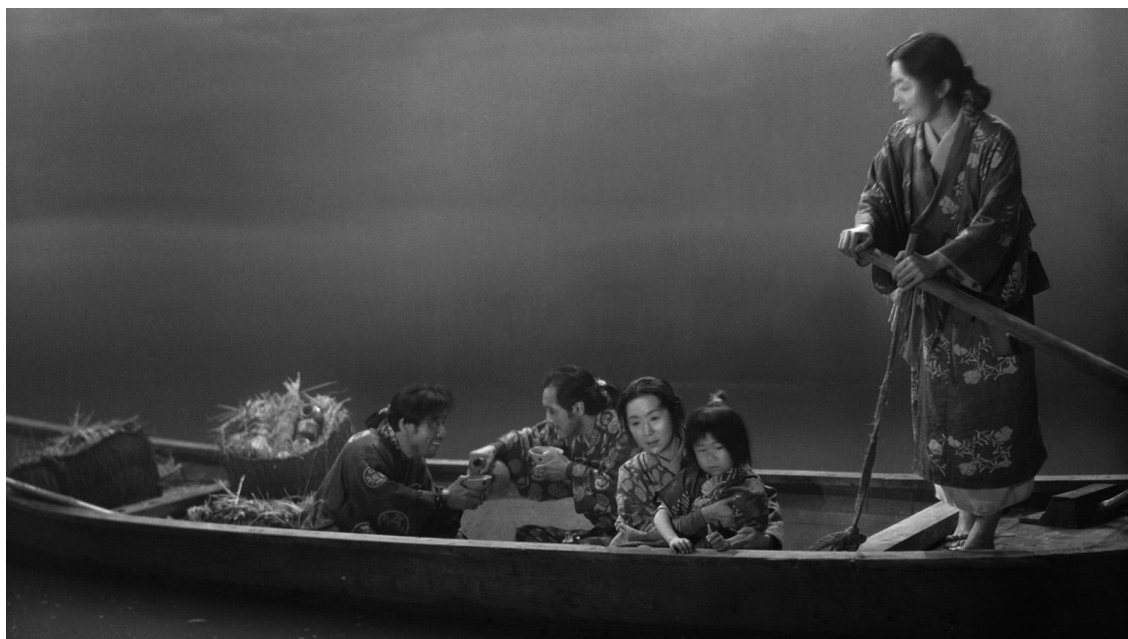
Ugetsu monogatari (Cuentos de la luna pálida), de Kenji Mizoguchi

Le seguirá Pickpocket (1959), obra de referencia de Robert Bresson , un filme muy influyente en la Nouvelle Vague y frecuentemente homenajeado por el director Paul Schrader. El siguiente título será The Apartment (1960), la oscarizada y más famosa película de Billy Wilder , un melodrama en forma de comedia en el que brillan los decorados de Alexandre Trauner.