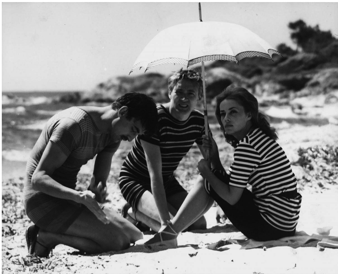
Fotograma de Jules et Jim (1962) de François Truffaut

Othello (1951), una de las catorce películas acabadas de Orson Welles , permite disfrutar de su maestría con el montaje, la adaptación con fuerza de la obra de William Shakespeare sin que se note su origen teatral, y la gran dirección artística de Alexandre Trauner.