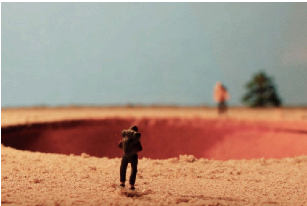
Imagen de Itzulera , de la compañía Dejabu