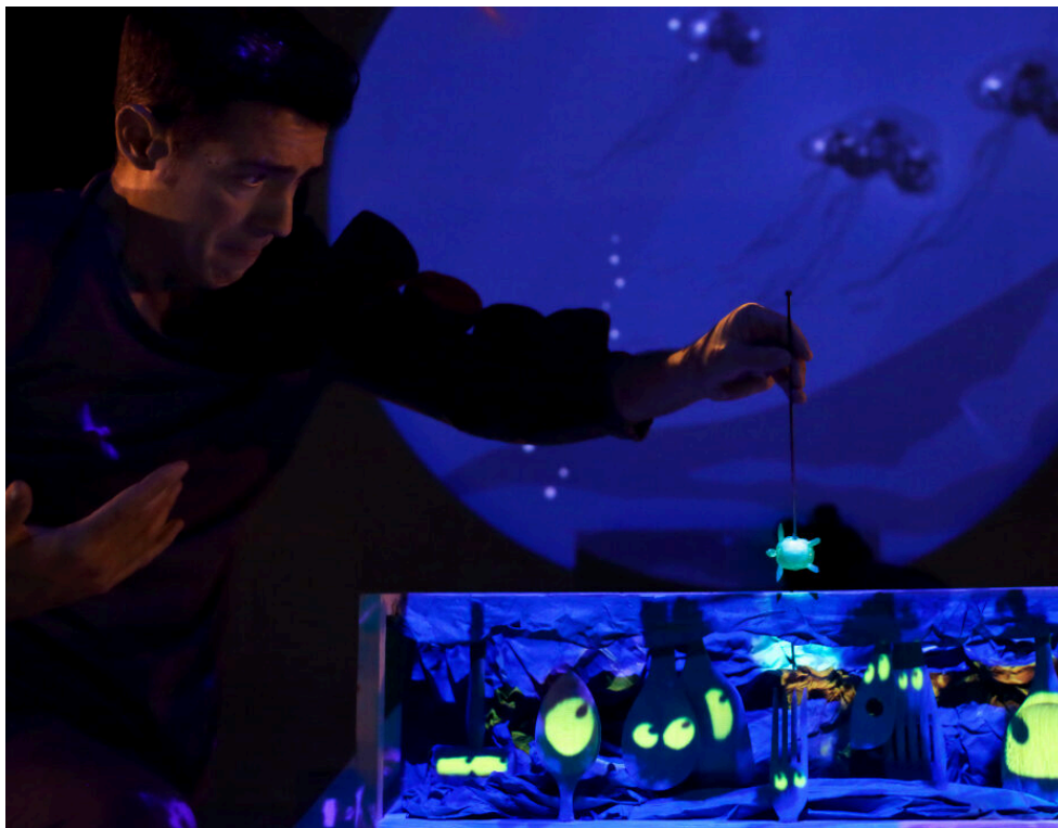
Imagen de Closka

Esta experiencia escénica sumerge al público en una reflexión sobre la belleza y el respeto al medioambiente, a través de un viaje fascinante protagonizado por una tortuga. PanicMap despliega su particular lenguaje artístico en el que entrelaza dramaturgia, artes visuales y tecnologías emergentes como el videomapping y live-cinema .