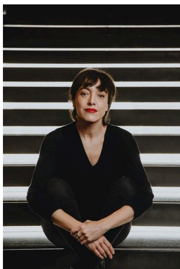
La fotógrafa Ixone Sádaba

El programa expositivo de 2025 arranca con el proyecto Escala 1:1 , exposición de la artista Ixone Sádaba que se inaugurará el próximo 6 de febrero en la Sala de Exposiciones del Centro.